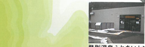
登別温泉ふれあいセンター「遊鬼」